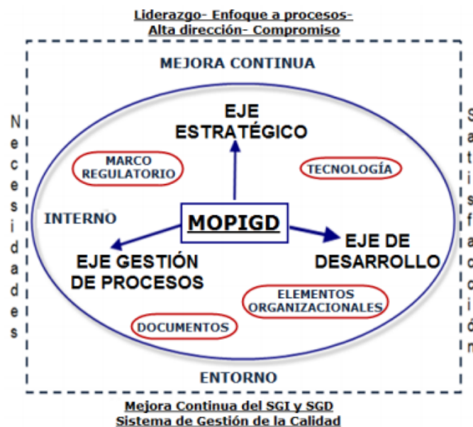
Figura 1: Representación de la estructura conceptual básica del modelo

El modelo también contempla el liderazgo y establece en cada una de sus etapas la implicación y compromiso de la alta dirección, lo que tributa al aseguramiento de la compatibilidad del sistema de gestión de documentos con la dirección estratégica de la empresa. Contribuye a la elevar la calidad de los procesos de auditoría y certificación e inserta la gestión de documentos a nivel estratégico dentro de la organización. Tributa en su esencia a la implementación del sistema de gestión de documentos, permitiendo la realización del diagnóstico de los sistemas actuales, revisión y estandarización de los mismos, concibe la gestión de documentos con enfoque sistémico, establece el enfoque basado en los procesos incorporando la mejora continua. Y tiene en cuenta todos los factores internos y externos que actúan en el sistema de gestión de documentos (requisitos legales, los procesos, los recursos, la tecnología y el contexto) de la organización.